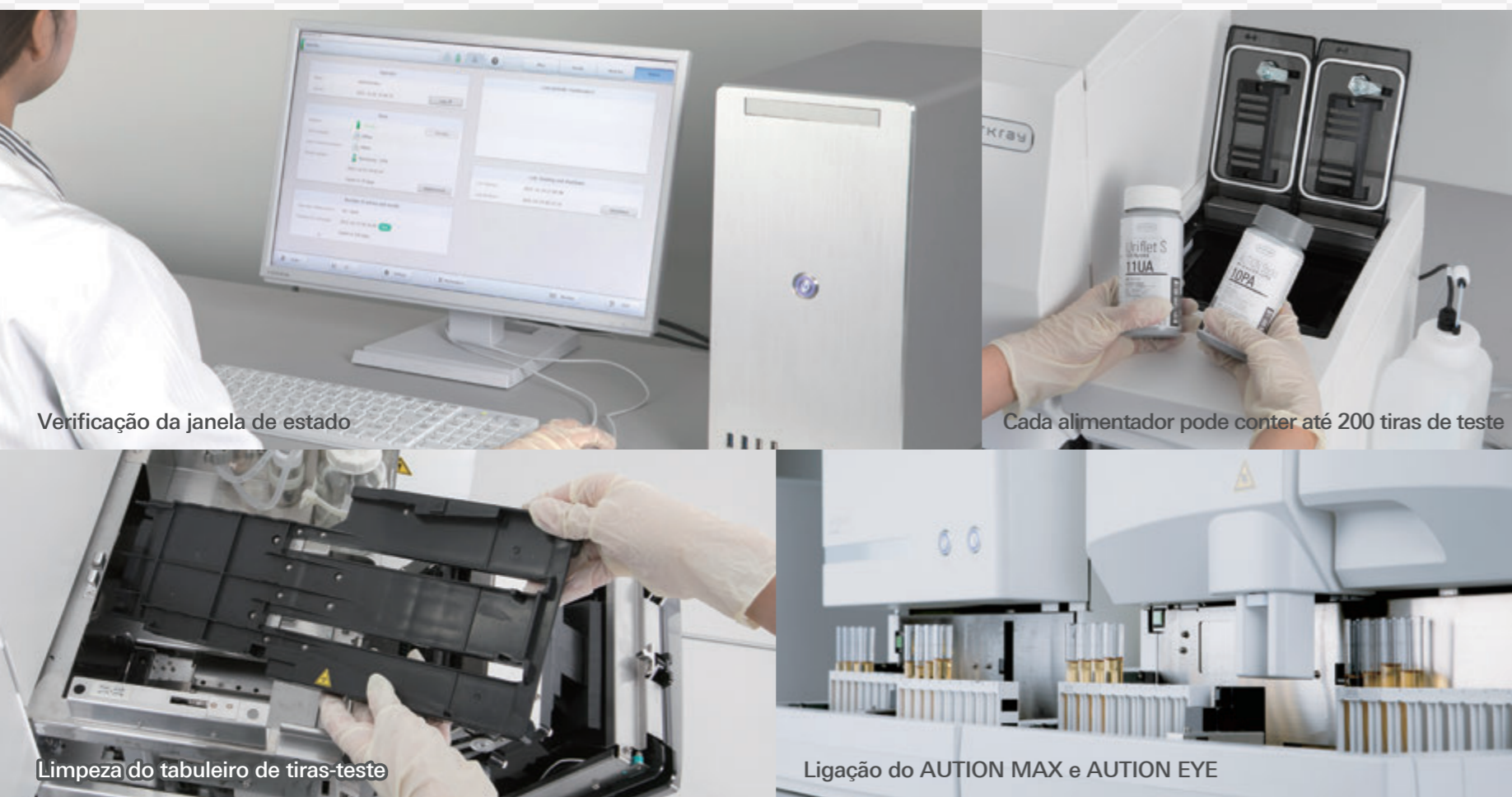
Verificação da janela de estado