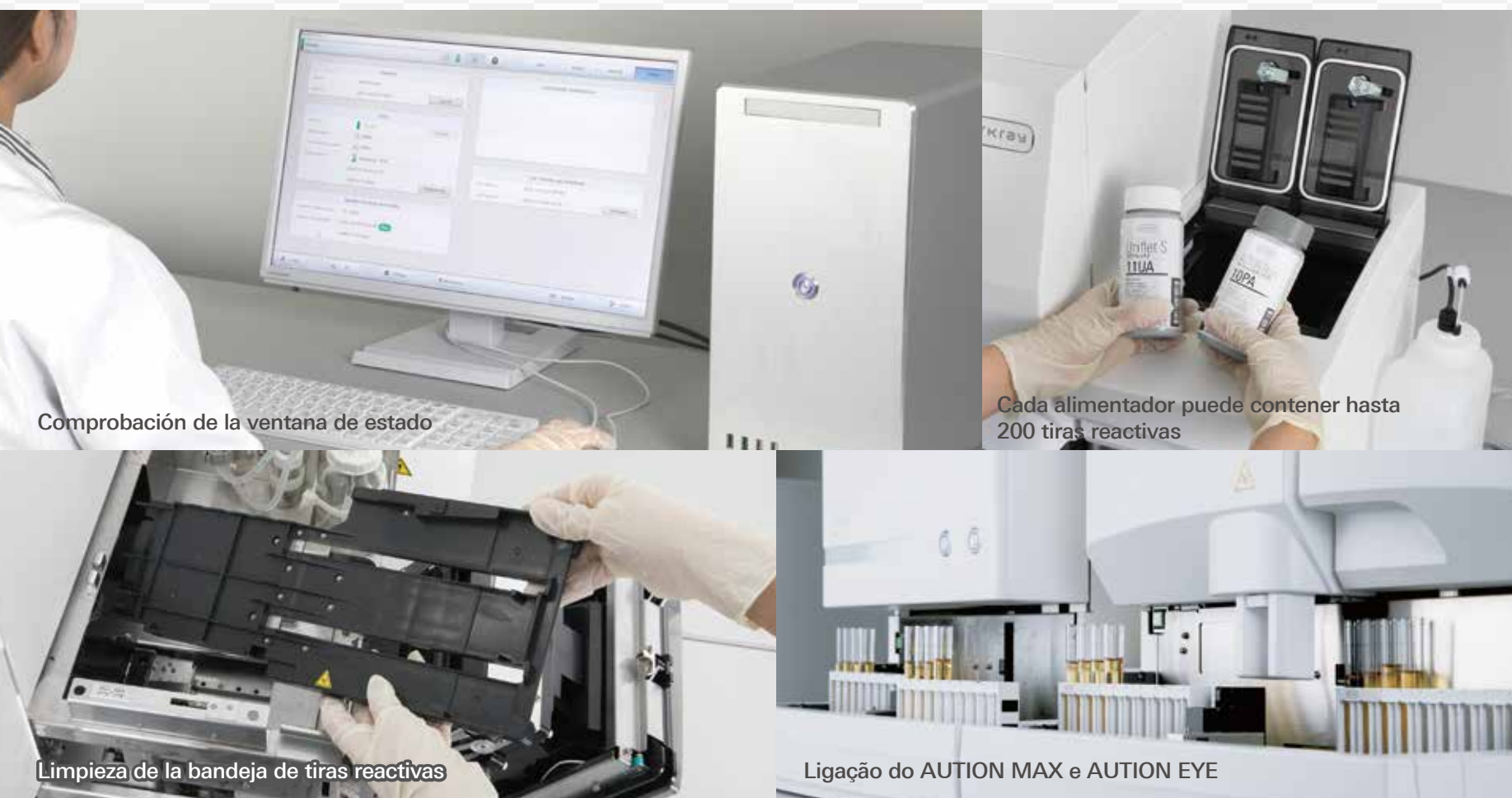
Comprobación de la ventana de estado